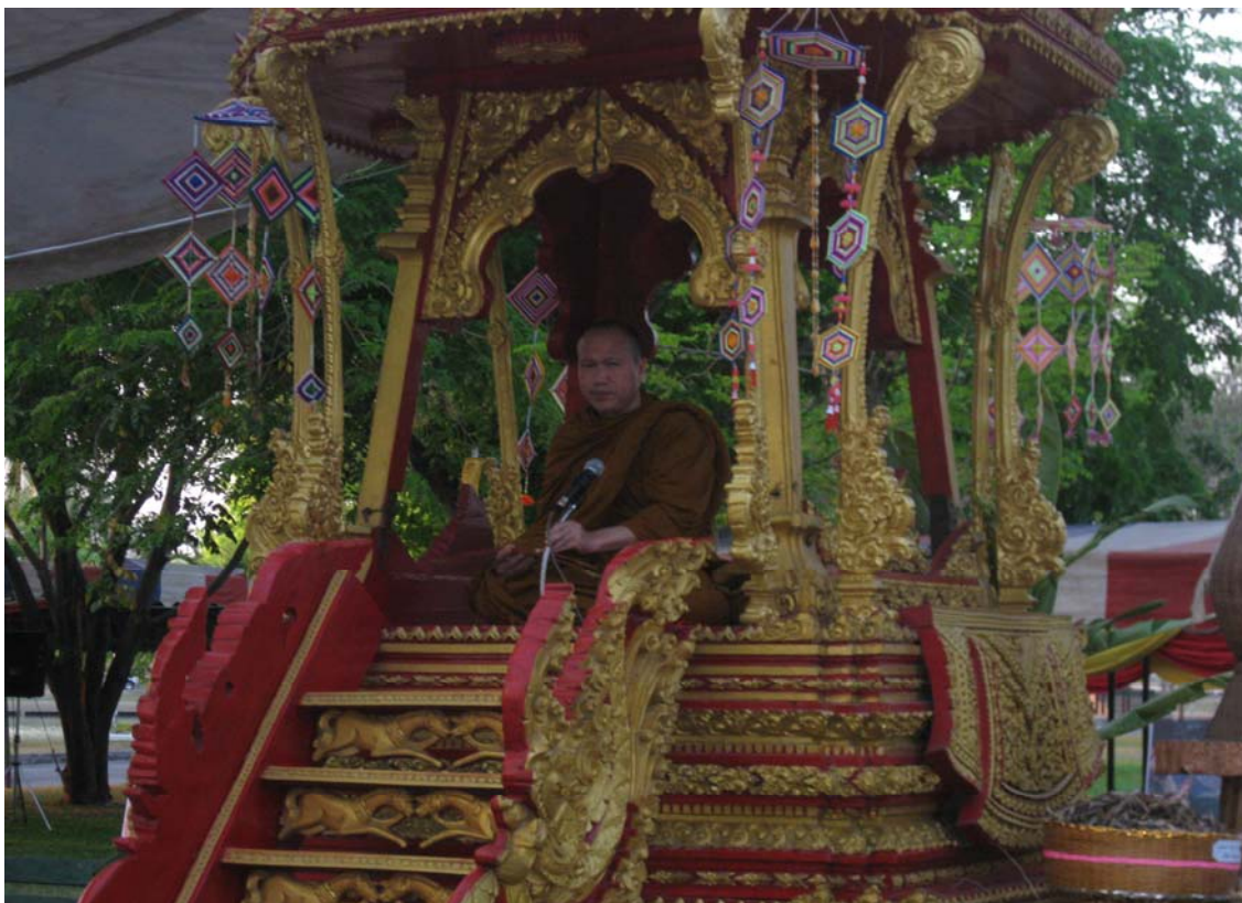
พระสงฆ์เตรียมเทศน์ผะเหวด