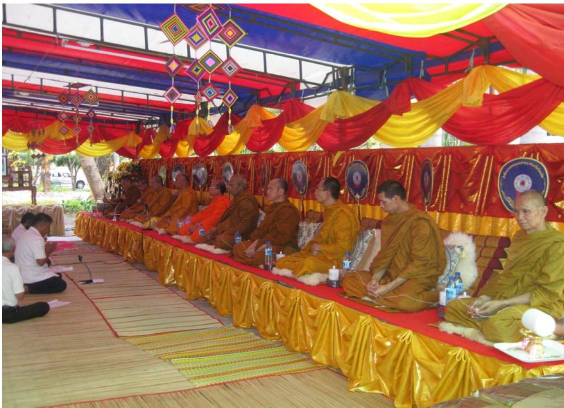
พิธีเจริญพระพุทธมนต์ฉลองพระอุปคุต บริเวณประรำพิธีเทศน์ผะเหวด