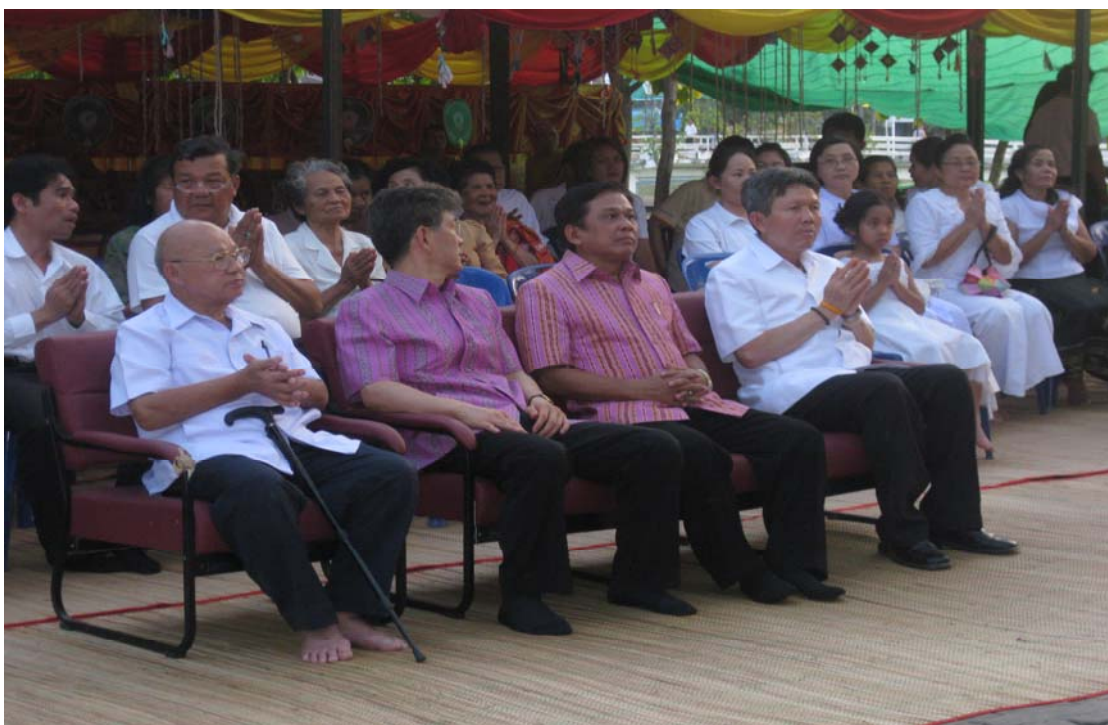
อุบาสกอุบาสิกา ร่วมฟังเทศน์ผะเหวด