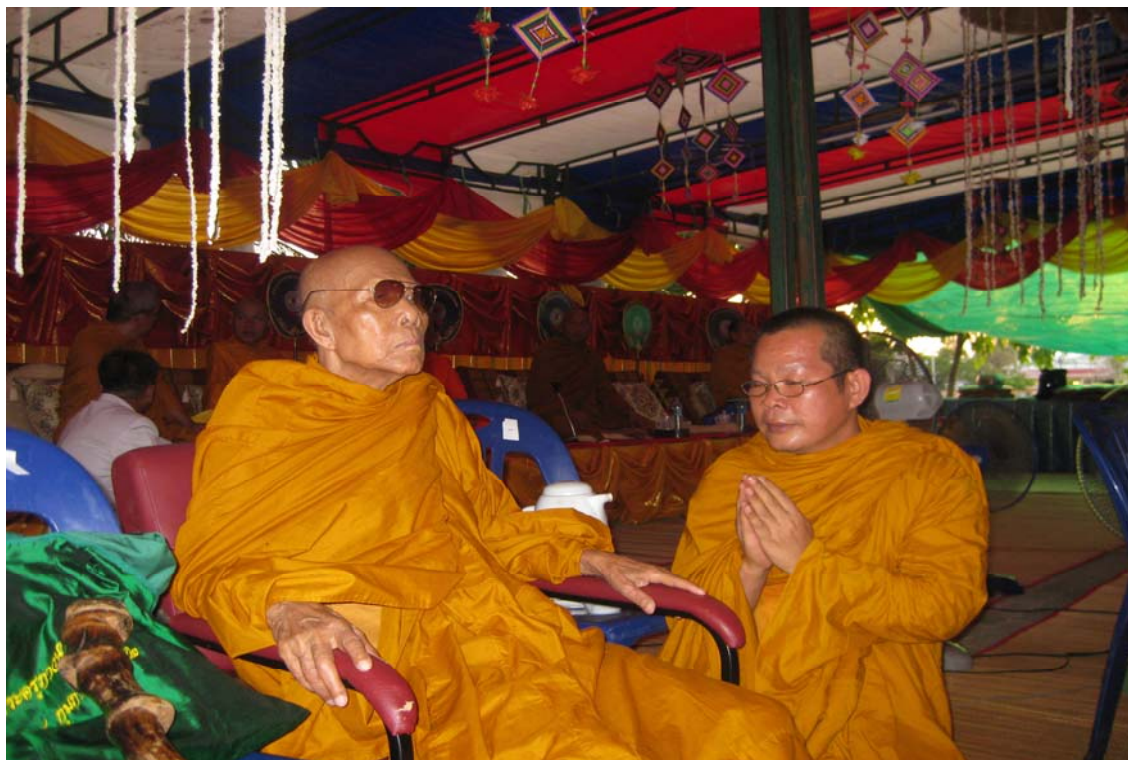
ผู้วิจัยขอคำปรึกษาเกี่ยวกับเรื่องบุญพะเหวดร้อยเอ็ด กับพระเดชพระคุณพระราชพรหมจริยาจารย์ วัดเวฬุวัน ที่ปรึกษาเจ้าคณะจังหวัดร้อยเอ็ดฝ่ายมหานิกาย