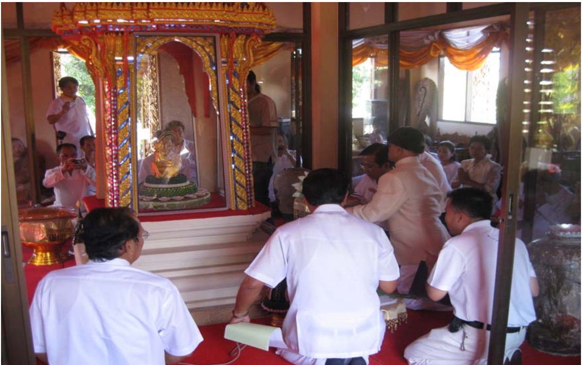
พิธีอัญเชิญพระอุปคุตที่หอพระอุปคุต