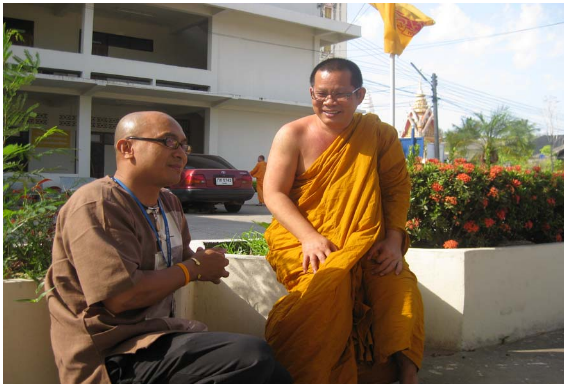
ผู้วิจัยกำลังสนทนากับชมราวาสที่เกี่ยวข้องกับการจัดงานบุญพะเหวด