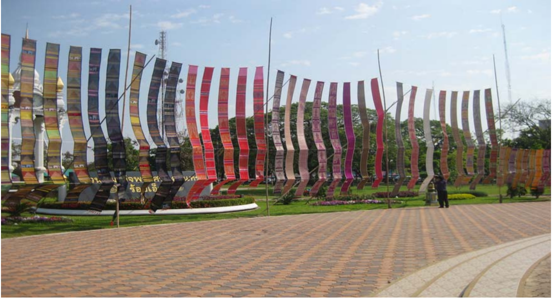
ธงพระแห่ รอบบึงปลาญชัย