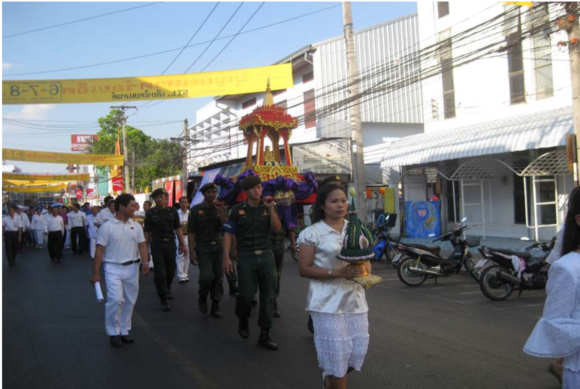
ขบวนแห่พระอุปคุตรอบเมืองร้อยเอ็ด